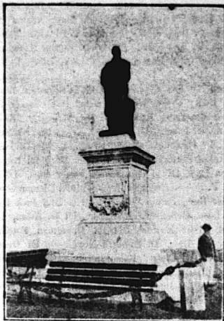
MONUMENTUL LUI OVIDIU

Astfel în curând această operă de artă a maestrului Ferrari va avea cadrul, pe care-l merită față de valoarea ei excepțională.